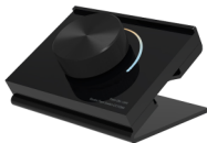
RK2 1区色温面板遥控器