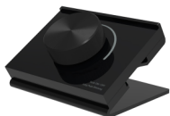
RK1 1区调光面板遥控器